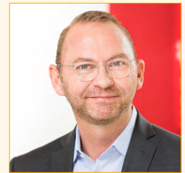
Frank Werneke ver.di-Vorsitzender

durchführen. Mitmachen kann übrigens auch jedes neue ver.di-Mitglied. Ein verdammt guter Grund also, um nochmal ordentlich die Werbetrommel zu rühren. Sprecht mit Euren Kolleg*innen in Betrieb oder Dienststelle über den erreichten Abschluss in schwierigen Zeiten und macht ihnen klar, wie wichtig Engagement und Solidarität sind! Denn zusammen geht mehr!